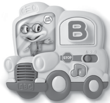
Fridge Phonics™ 2+ years

Fun next steps on your child's path to learning!