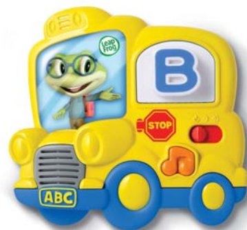
Hrací abeceda Fridge Phonics™ od 2 let

Zábavné krůčky vašeho dítěte v cestě za vzděláním!