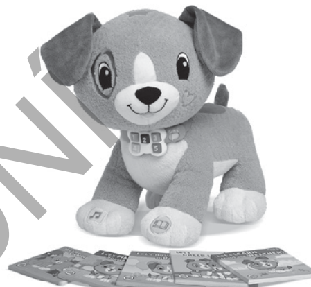
Read With Me Scout™ 2-5 years