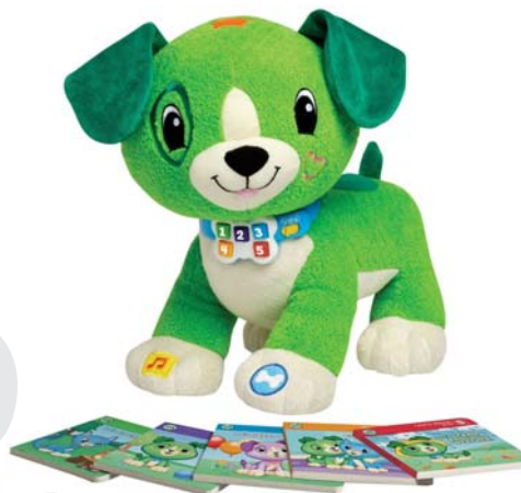
Read With Me Scout™ Mluvicí pejsek Scout 2-5 let