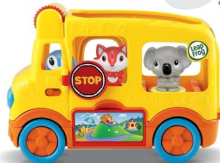
Learning Friends™ Adventure Bus Dobrodružný autobus plný kamarádů od 2 let

Ještě více nápadů jak podpořit vaše dítě ve vzdělávání najdete na: leapfrog.com